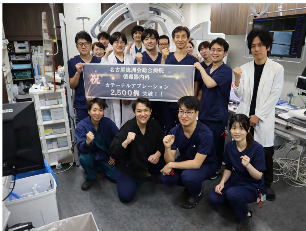
▲カテーテルアブレーション治療に携わる医師とスタッフ

近隣クリニックからの紹介が増えたことで、当院で治療を受けられる患者さんの幅が広がり、より早期の段階で適切な治療へつなげられるようになりました。また、スタッフの専門性向上や設備の充実も進み、安全性と治療成績の向上につながっています。