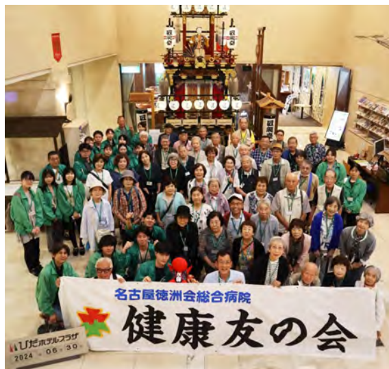
▲高山名物「山車」との1枚