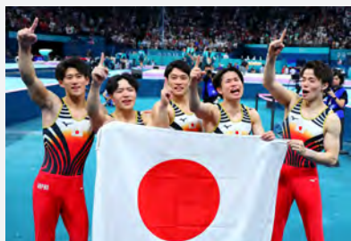
▲体操男子日本代表